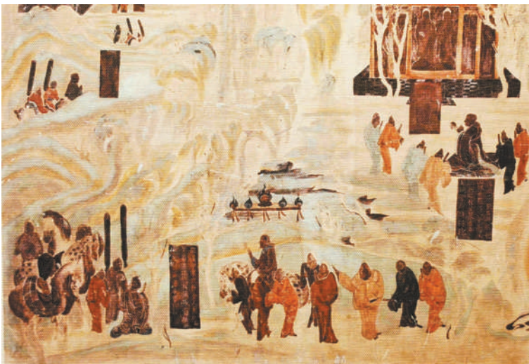
敦煌莫高窟初唐时期作品《张骞出使西域图》，展现了敦煌这个“华戎所交，一大都会”的繁华景观。

中国在英语里称为“China”，这个词的本义是“瓷器”。然而早在公元前5世纪，中国丝绸就远销海外，古代希腊和罗马人称中国为“丝国”。郭沫若《中国史稿》中说：“中国是世界上最早使用蚕丝的国家，中国丝织品在那时已经享有国际盛誉，特别是在罗马帝国，人们把中国丝织品当作极珍贵的物品，对于东方‘丝国’充满着憧憬和向往。”