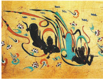
敦煌莫高窟壁画《飞天》

凉州一派安定繁荣。在哥舒翰举办的宴会上，人们表演着外来的杂技乐舞，接受外国人的贡赋：“哥舒开府戏高宴，八珍九馔当前头。前头百戏竞撩乱，丸剑跳掷雪浮浮。狮子摇光毛彩竖，胡腾醉舞筋骨柔。大宛来献赤汗马，赞普亦奉翠茸裘。”