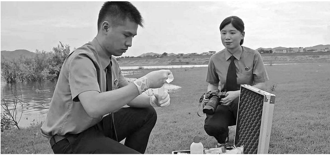
清远市检察院检察干警运用快检设备进行现场水质检测。