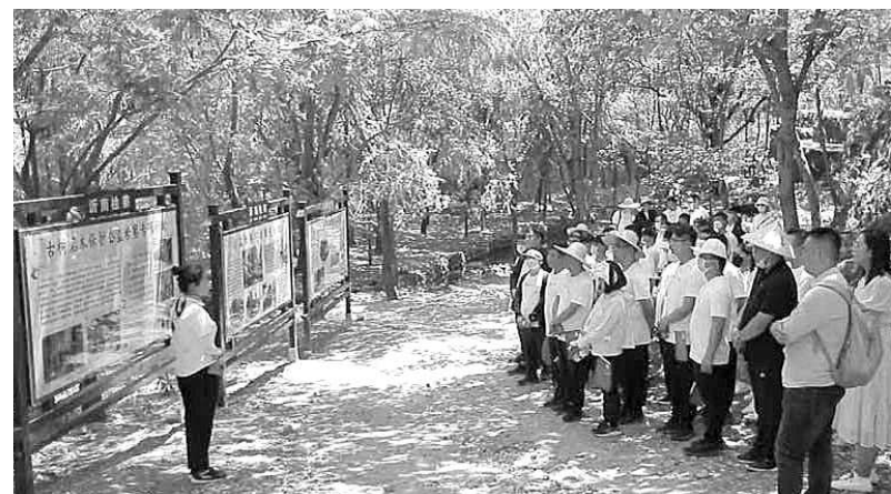
沂南县沂蒙红色影视基地景区讲解员向游客普及古树保护公益诉讼检察知识。

邀请人大代表、政协委员和人民监督员、基层林长代表到部分古树所在地,现场查看树木管护情况,为古树保护、生态保护公益诉讼检察工作建言献策。同时,不少热心群众通过电