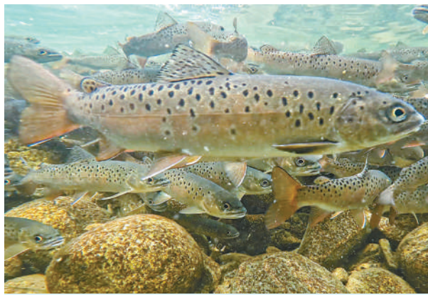
延伸阅读·秦岭细鳞鲑

秦岭细鳞鲑俗称“梅花鱼”“寒水鱼”，为中国所特有，仅分布于秦岭地区海拔900米至2300米的渭河上游及其支流和汉水北侧支流渭水河、子午河上游的溪流中。秦岭细鳞鲑被称为“水中活化石”，是秦岭生物多样性的重要组成部分，具有重要的科研和生态价值。受环境和人为因素的影响，秦岭细鳞鲑一度濒临灭绝，我国将其列为国家二级重点保护水生野生动物。