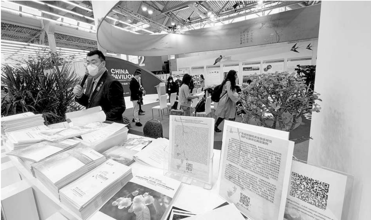
在《生物多样性公约》第十五次缔约方大会会场中国角展示的生物多样性保护检察公益诉讼典型案例宣传册。

作为破解“公地悲剧”世界难题的“中国方案”,中国检察公益诉讼在生物多样性保护中发挥的制度优势有目共睹,并且,正在从传统的注重对重点名录野生动植物的数量保护,进步和升级到强化对各类物种生态功能和生态环境的系统保护,特别是依托食品药品安全、湿地保护、黑土地保护、国家公园保护等,综合保护野生动物种群和栖息地生态系统,积累了许多实践经验。野生动物保护法修订草案即将再次提请全国人大常委会审议,检察公益诉讼能否走进这部法律?