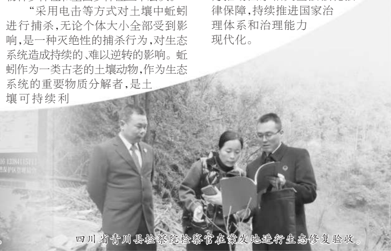
四川省青川县检察院检察官在修复地进行生态修复验收。