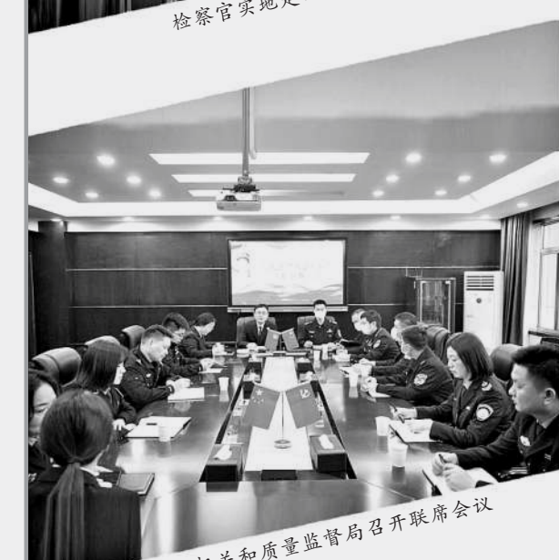
与公安机关和质量监督局召开联席会议