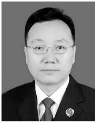
二级大检察官 北京市人民检察院 检察长 朱甄频