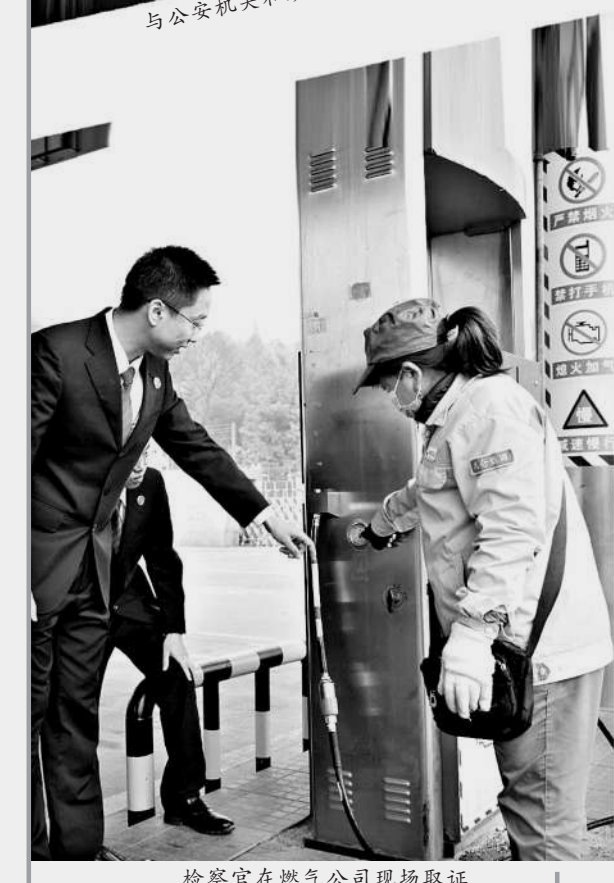
检察官在燃气公司现场取证