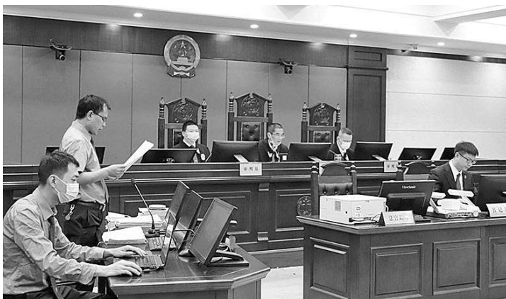
今年6月，贵州省六盘水市检察院检察官出庭支持公诉一起毒品犯罪案件。

此外，六盘水市检察机关加强与公安机关、法院的沟通联系，不定期举行座谈、会商，对毒品犯罪案件的侦查方向、取证范围、证据固定、涉案财产处置等问题达成共识，建立每季度向公安机关通报毒品犯罪案件办理中的违法情形等制度，形成惩治毒品犯罪工作合力。今年以来，该市检察机关已对公安机关应当立案而不立案的监督立案5件5人，不应当立案而立案的监督撤案38件38人，发出纠正违法通知书41份。（周政）