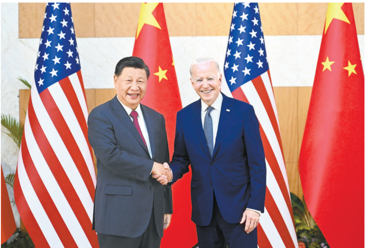
当地时间11月14日下午，国家主席习近平在印度尼西亚巴厘岛同美国总统拜登举行会晤。