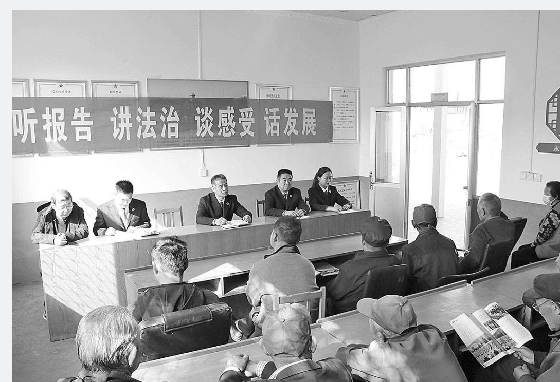
上图:近日,山东省沂源县检察院干警深入鲁村镇南岭二村、悦庄镇中营村开展“听报告、讲法治、谈感受、促发展”主题宣讲进农村活动。活动中,检察干警领学了党的二十大精神,并结合检察工作实际,开展普法活动。

在听取最高检挂职、驻村干部汇报工作生活情况后,应勇代表最高检党组和张军检察长向他们及家人表达诚挚的敬意和问候,并勉励大家,到基层和艰苦地区工作,是最生动的国情教育、党的宗旨教育、初心使命教育。希望大家不断加强学习,苦练本领、磨砺意志、锤炼品格,带头学习和宣讲党的二十大精神,以人民为师,不断提升基层工作能力、群众工作能力、推动高质量发展能力、防范化解风险能力。应勇叮嘱大家,在外工作要照顾好自己,同时要模范遵纪守法,展示好最高检和检察人员的良好形象。 云南省委常委、政法委书记杨亚林,省检察院检察长王光辉一同调研。