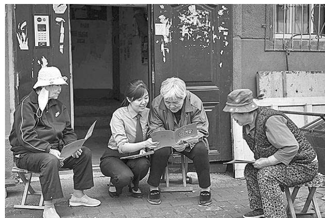
近日,辽宁省鞍山市铁东区检察院干警深入社区开展防范养老诈骗法治宣传活动,向群众宣讲养老诈骗违法行为惯用手段及防范对策等,并为群众答疑解惑。

据悉,打击整治养老诈骗专项行动开展以来,重庆市检察机关坚持打防、治、管“三管齐下”,依法严惩养老诈骗违法犯罪,延伸治理侵害老年人合法权益的涉诈乱象问题。截至目前,该市检察机关共批捕涉养老诈骗案件292人,起诉221人,追捕追诉79人,立案监督13人,移送犯罪线索8条。该市检察机关组织检察干警深入养老机构、社区、广场、学校等开展宣传活动150余场次,受众21万余人,结合办案向金融监管、医疗保障等单位制发检察建议、法律风险提示函12份,提起老年人权益保障民事公益诉讼5件。