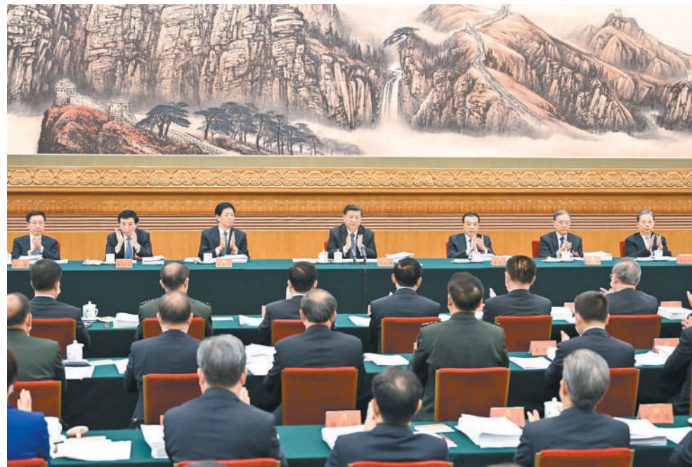
10月18日，中国共产党第二十次全国代表大会主席团在北京人民大会堂举行第二次会议。习近平同志主持会议。