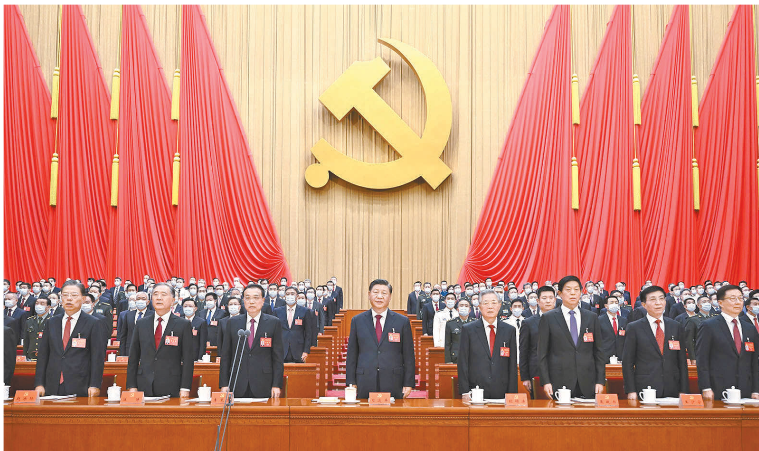
10月16日,中国共产党第二十次全国代表大会在北京人民大会堂开幕。习近平代表第十九届中央委员会向大会作报告。