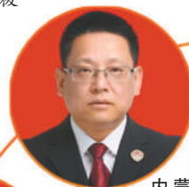
内蒙古自治区人民检察院党组书记、检察长李琪林

广西检察机关刑事检察按案件类型设置机构，实行类案专办；“案-件比”和监督立案率、监督撤案率、纠正漏捕漏诉率等反映办案质效的案件质量主要评价指标，连续多年排名居全国前列；推进刑事执行检察改革，自治区检察院设立5个直属派出所，实现对自治区监狱监督全覆盖，全面深化巡回检察的做法入选2022年全国检察机关检察改革典型案例；参与办理万峰湖流域生态环境受损公益诉讼案，7名办案人员获最高检表彰，检察监督质效得到全面提升。