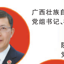
广西壮族自治区人民检察院党组书记、检察长茅仲华