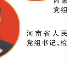
河南省人民检察院党组书记、检察长段文龙