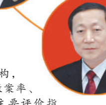
陕西省人民检察院党组书记、检察长王旭光