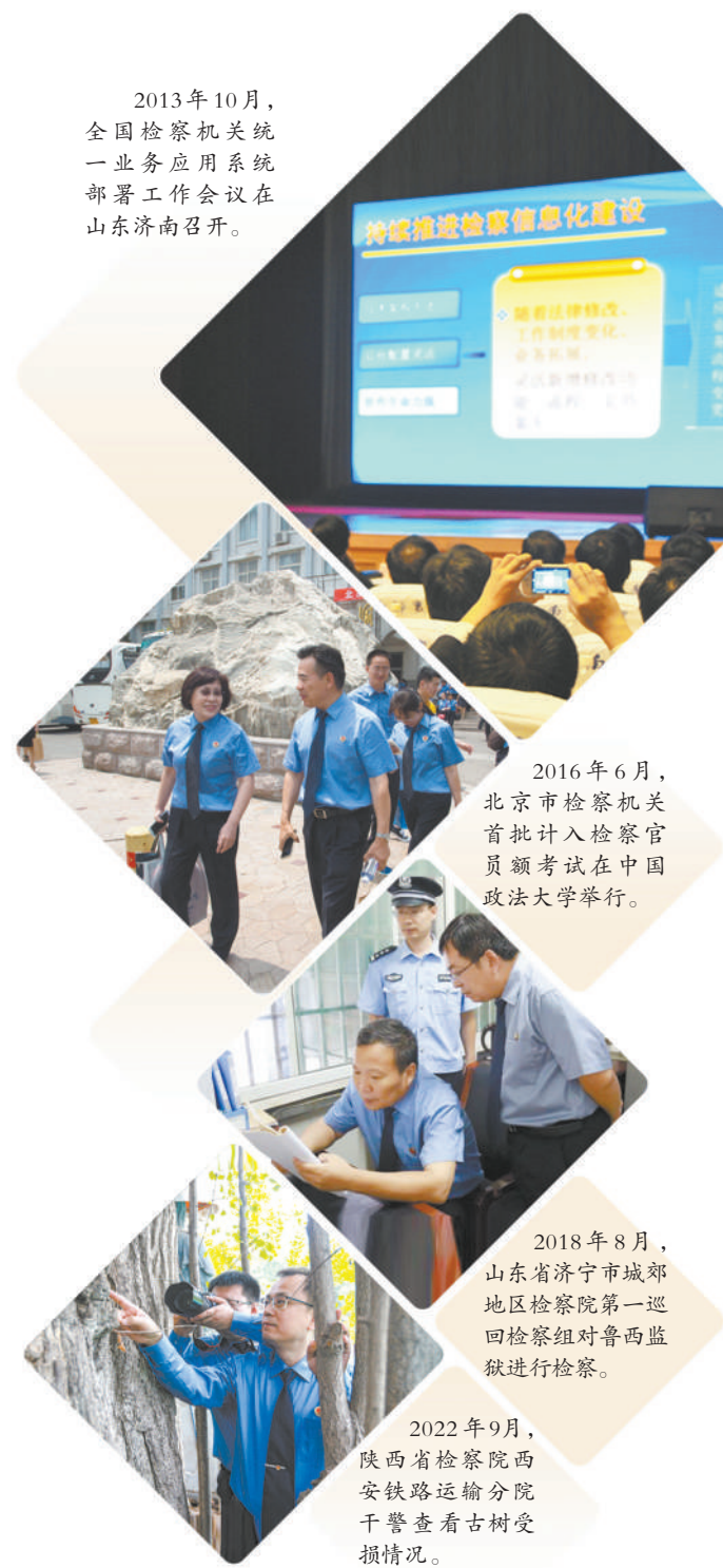
2016年6月，北京市检察机关首批计入检察官员额考试在中国政法大学举行。