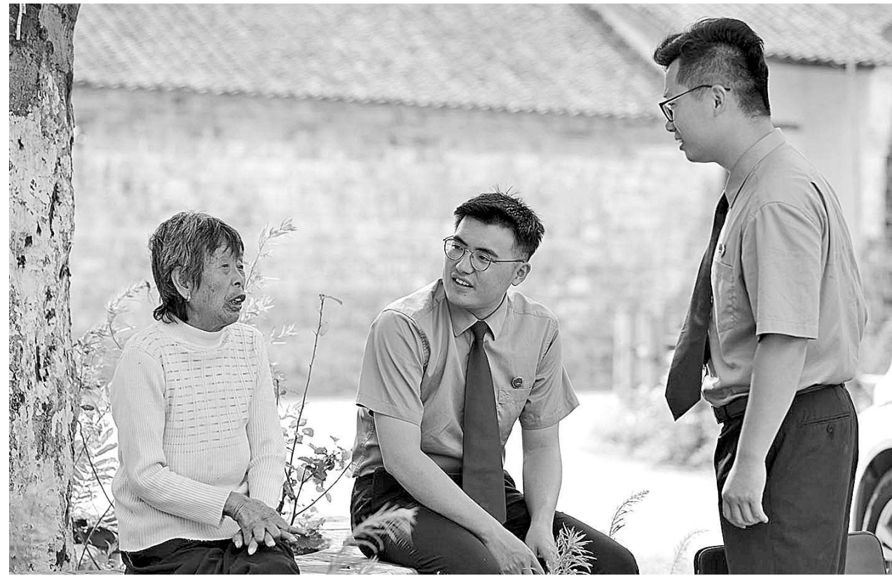
办案检察官在老湾村走访村民了解古村落保护工作

经调查发现,这些古村落都有不同程度损毁、核心保护范围杂草丛生、进入古村落的人口无相关标识等共性问题。同时,检察官还发现,何家冲村建筑外墙颜色已经改变,破坏了传统村落的真实性;老湾村核心区的一处房屋被拆除,原址上仅剩下一堆瓦砾;老湾村有村民擅自搭建简易用房。