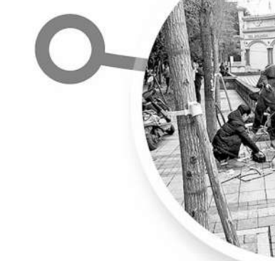
图①:整改前的米邦沱码头

多方走访勘查发现,某汽修厂位于米邦沱码头下河通道入口处,占地面积约1100余平方米,分为修理厂和洗车场两部分,其中修理厂及办公用房占地800余平方米,洗车场占地300平方米。修理厂厂房部分为彩钢结构、部分为砖混结构,均位于长江河道管理范围内,且全部位于