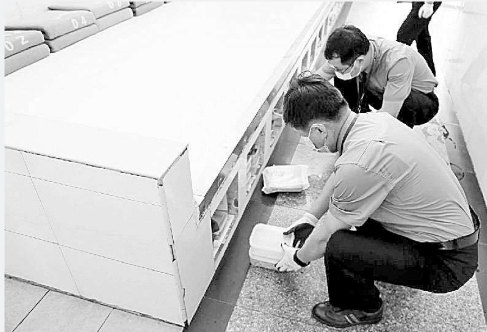
江苏省镇江市检察院近日组织扬中市检察院对句容市看守所、丹徒区司法局社区矫正工作开展常规巡回检察。在句容市看守所,巡回检察组通过发布巡回检察公告、深入监室实地检查、查看台账资料、发放调查问卷、与相关人员谈话等方式,对该所执行相关法律法规以及监管活动情况进行全面检察;在丹徒区司法局,巡回检察组通过与相关人员谈话及调阅、复制有关材料、发放问卷调查表、查看矫正档案等方式,对该局执行社区矫正法律法规、开展社区矫正监管工作等情况开展检察。目前,扬中市检察院已向镇江市检察院提交两次巡回检察的反馈意见。

左图:巡回检察组进入监区现场检查。 右图:巡回检察组对看守所监室开展清监检察。