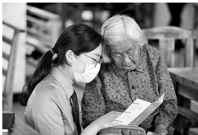
近日,浙江省义乌市检察院干警将近期办理的一批养老诈骗案印制成宣传资料,向辖区老人开展上门法治宣传,提高老人们的防骗意识。 本报记者范跃红 通讯员赖朝桐摄

本报讯(通讯员马士江 王凤荣) 近日,在河北省临西县检察院倡议下,该院与河北省临清市、馆陶县、清河县、故城县、大名县、魏县6个京杭运河沿岸县市检察院协同制发《关于大运河流域治理检察公益诉讼协作机制实施意见》。此前,临西县检察院在开展大运河流域治理保护中发现,大运河两岸因归属不同区划而面临治理难题,于是倡议与运河两岸、上下沿岸的属地检察院携手,实施跨省市运河协作保护机制。该机制包括水旱灾害防御、水资源管理、河道滩涂管理、水土保持等方面,确立了定期会商研判、专项统一行动、线索互相移送、协同调查取证等内容,并强化了检察协作保障的各项具体措施。