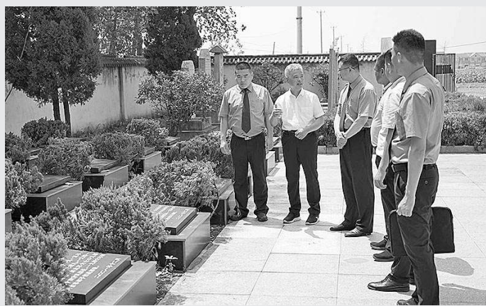
7月25日,江苏省东海县检察院公益诉讼办案组实地走访辖区烈士陵园,并与有关部门详细讨论该县散葬烈士墓集中迁移保护工作。