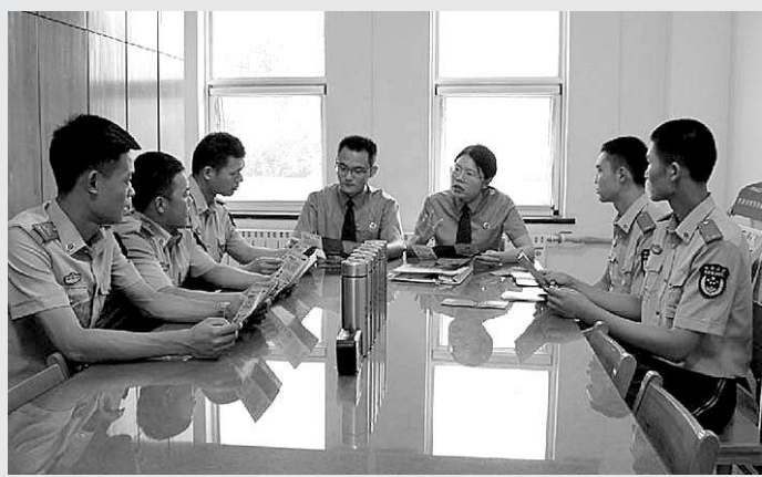
近日,山东省德州军检察院组织干警到武警德州支队开展“法治宣传进军营”活动。活动中,双方就如何依法妥善处理涉军案件等进行深入研讨。