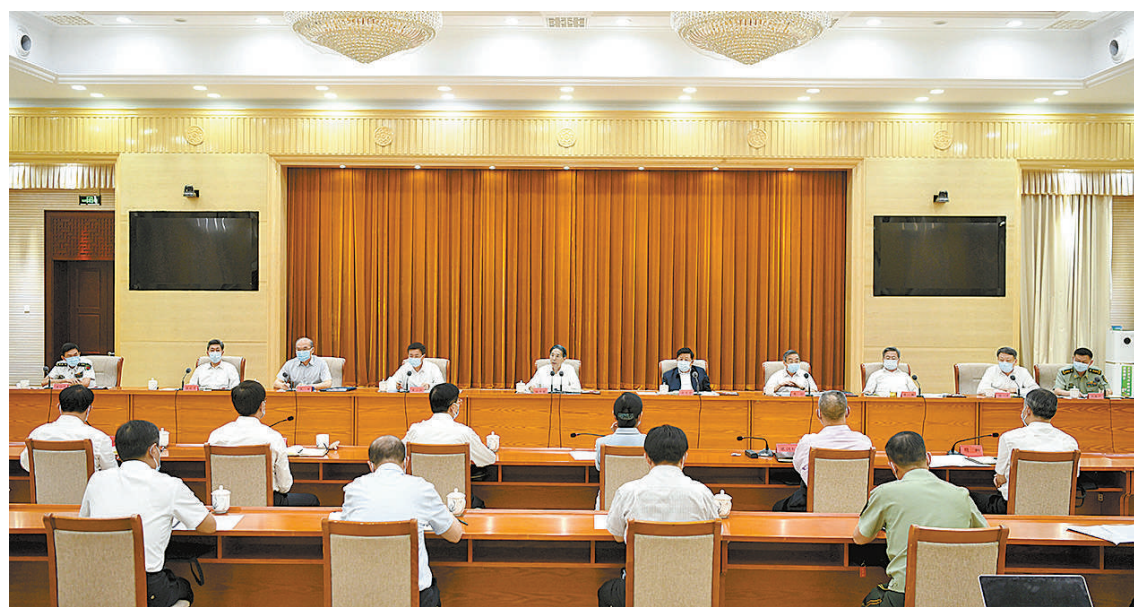
7月29日，中共中央政治局委员、中央政法委书记郭声琨主持召开中央政法委员会全体会议并讲话。

本报北京7月30日电(记者徐日升) 7月29日，中央政法委员会召开秘书长会议，学习贯彻习近平总书记7月26日在省部级主要领导干部专题研讨班上重要讲话精神。中央政法委书记陈一新强调，要把学习贯彻习近平总书记重要讲话精神作为当前首要政治任务，深刻领悟“两个确立”的决定性意义，增强“四个意识”、坚定“四个自信”、做到“两个维护”，尽心尽责担当作为，以实际行动迎接党的二十大胜利召开。