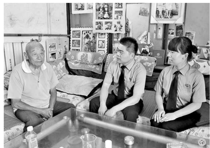
图①：修缮前的中共张秋县委办公旧址 图②：检察官向相关单位送达检察建议书 图③：修缮后的中共张秋县委办公旧址 图④：检察官查看整改修缮后的旧址 图⑤：检察官听当地老党员讲述军民英勇抗战故事