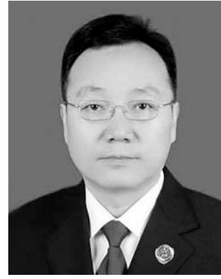
二级大检察官 北京市人民检察院 检察长 朱雅娟

今年以来,北京市检察机关认真贯彻最高检“质量建设年”部署,不断完善检察业务考核评价制度、检察业务数据研判和科技赋能检察支撑机制,坚持“统分结合”,突出“更高质量、更有效率、更加公平、更可持续、更为安全、更富实效”的检察业务质效价值取向。在此背景下,朝阳区检察院围绕“数量是基础”工作要求,树立“大数据”思维,创新数据保障工作机制,不断推动检察供给侧改革,实现高质量发展。