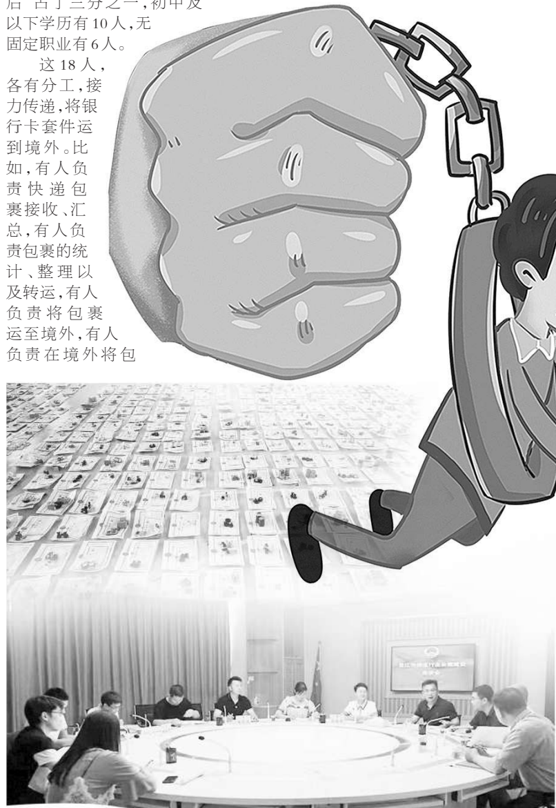
上图:福建省晋江市检察院办理的妨害信用卡管理案被查获的对公账户资料 下图:福建省晋江市召开物流行业合规建设座谈会

成效源自实打实的工作举措。记者了解到,结合办理该案反映出的物流行业经营的风险问题,晋江市检察院会同当地商务、交通运输、海关、邮政部门联合制发了《晋江市物流行业合规建设指引(试行)》,通过建立健全物流行业合规风险管理体系,加强对行业风险的有效识别和管理,促进物流行业合规建设。同时,督促物流企业加强内部人员法治教育,加大以案释法。