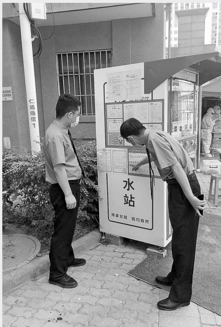
乌鲁木齐市水磨沟区检察院检察官对现制现售饮用水安全公益诉讼案进行“回头看”