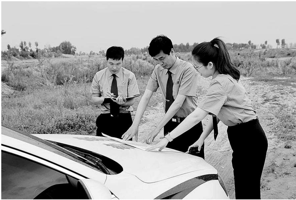
近日,办案组成员在宁城县老哈河河道开展公益诉讼立案调查。