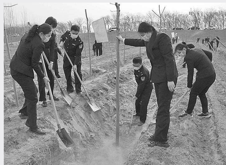
东阿县检察院检察官在黄河沿岸公益林区参与植绿复绿活动