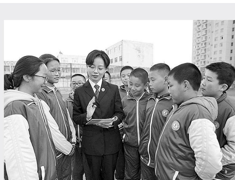
东平县检察院检察官深入中小学开展爱护母亲河法律宣传活动