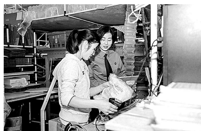
近日,四川省绵阳市检察院干警走进当地重点电商企业,实地了解企业经营情况,听取企业法治需求,并向企业职工宣讲寄递安全相关法律知识。

本报讯(记者沈静芳 通讯员贾琳琳) 近日,内蒙古自治区检察院与内蒙古残联联合召开“检察公益诉讼助推残疾人等特殊群体合法权益保护”新闻发布会,介绍该院近年来围绕残疾人、老年人等特殊群体无障碍环境建设问题,开展公益诉讼专项监督督促行政切实履职的工作情况。2021年1月至今,全区检察机关共受理无障碍环境建设公益诉讼案件线索215件,立案162件;通过公益诉讼督促修复毁损破坏的无障碍设施1040处,督促清除城市主要道路上的盲道障碍物565处,督促改造公共场所配套无障碍设施115个。