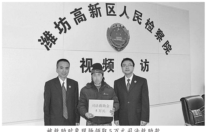
被救助对象现场领取5万元司法救助款

碍。我担心她出事,建议及早救助!”办案检察官介绍案情时流露出内心的焦虑。 “救,不仅要救,这种情况还应尽快救助!”该院领导一声令下,办案检察官以最快速度开展工作,引导被害人亲属申请司法救助,同时适当提高救助额度,最大限度帮助未成年被害人渡过难关。很快,3万元救助款发放到位。 “司法救助绝不只是发放救助款,更重要的是人文关怀。”办案检察官说。 针对被害人情绪困扰和心理危机,该院及时安排有心理咨询师资质的检察官为其提供心理辅导,帮助她修复心理创伤,化解心理障碍,并指导其家人及时办理转学,帮助孩子化解厌学情绪,重拾生活信心。 司法救助一头牵着百姓疾苦,一头系着司法关爱,是一项民心工程。据了解,本着应救尽救、应救即救原则,该院2021年共救助7名案件当事人,发放救助款19万元。 “我们希望能够帮助更多需要救助的人,尽最大努力让他们重拾对生活的希望和热爱,从办案中切实感受到公平正义就在身边。”该院检察长周金明表示。