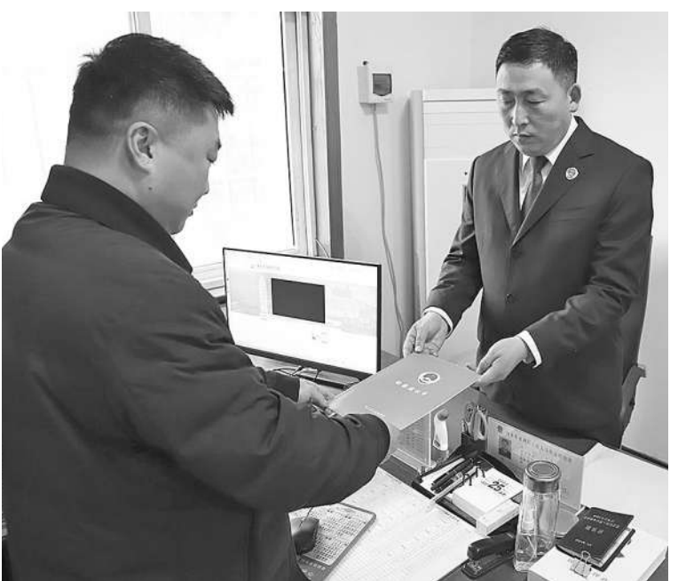
检察官向监管部门递交检察建议