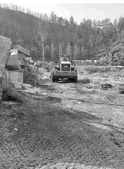
整改清理后的河道既平整又通畅