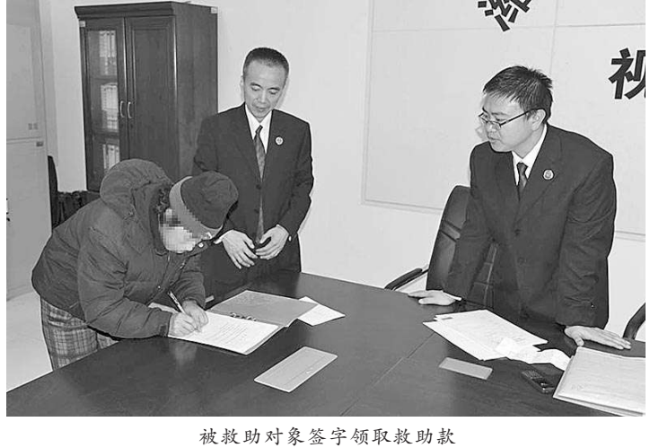
被救助对象签字领取救助款