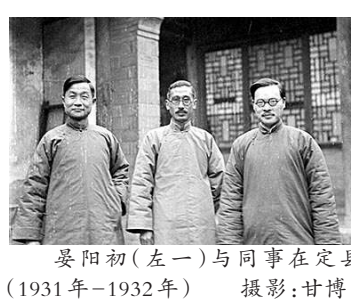
晏阳初(左一)与同事在定县(1931年-1932年)

1942年6月,晏先生坐火车北上时,窗外的酷暑下,农民即使在农闲时节“还在田地里挥汗如雨地劳动着”,萧条的城市“蓬头垢面的乞丐,倒在路边的浮尘里……从车子飞速驶过的一瞥中,根本不知道他们是死是活”。真实而残酷的景象坚定着晏阳初先生的使命感。