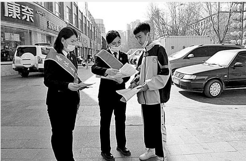
近日,新疆维吾尔自治区拜城县检察院干警走上街头开展普法宣传,现场讲解未成年人保护法、家庭教育促进法,以及预防校园暴力、性侵害、毒品侵害等相关内容。