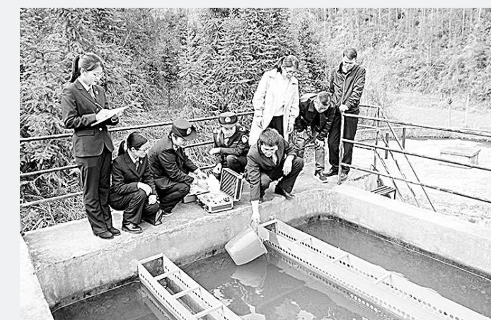
上图:日前,江西省安远县检察院在该县范围内开展农村饮用水安全专项检察监督活动。图为该院干警协同有关部门工作人员对某水厂进行水质检测。