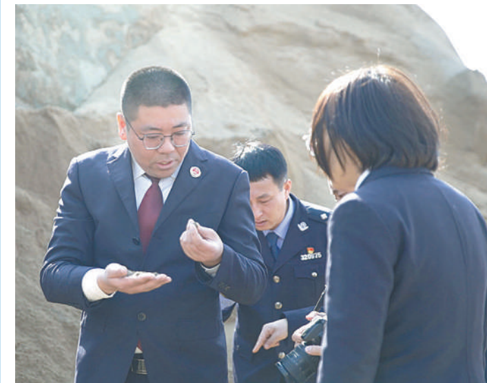
办案检察官和侦查人员调查核实江砂资源损失情况