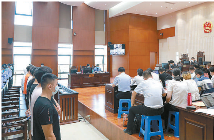
程某等33人诈骗案庭审现场

工不同,他们联系、接触的被害人存在不同程度的交集,每个人联系的诈骗对象和涉及的诈骗金额相互交织,取证工作在开始阶段非常艰难。