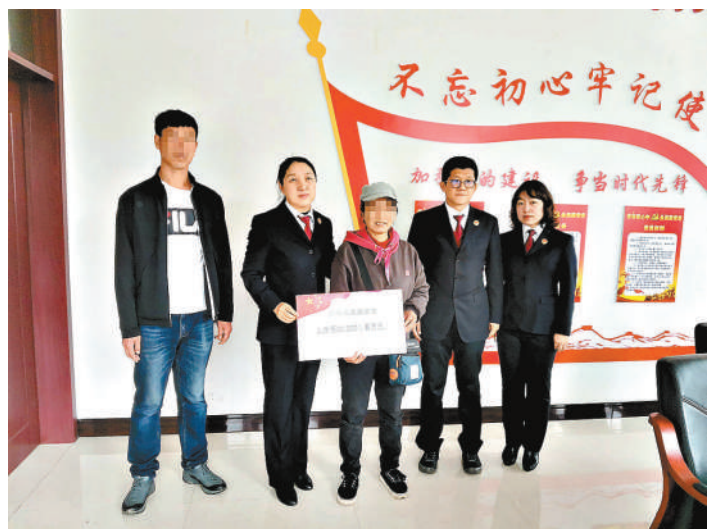
辽宁省抚顺市检察院检察官向命案受害家庭发放救助金