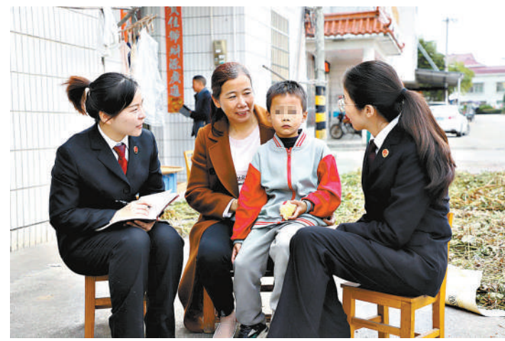
江西省宜春县检察院干警上门了解救助对象的学习生活情况

2022年2月22日，21世纪以来第19个指导“三农”工作的中央一号文件——《中共中央、国务院关于全面推进乡村振兴重点工作进行部署。随着一项项工作推进，检察机关手握“司法救助”的笔刷，在乡村振兴的画卷上，正用“以人民为中心”的笔触，勾勒出为大局服务、为人民司法的线条，奋力绘就乡村振兴的壮美画卷。