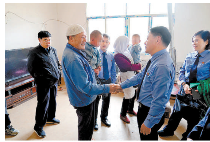
浙江省宁波市检察院检察官到云南省昭通市救助申请人住处调查核实