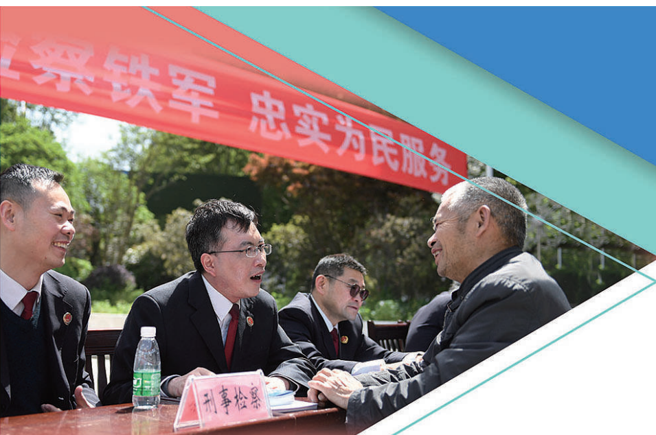
2021年4月,江苏省淮安市检察院开展检民社区“面对面”活动,主动征询群众意见建议。

2021年,全国检察机关坚持以习近平新时代中国特色社会主义思想为指导,全面贯彻习近平法治思想,在党中央坚强领导和全国教育整顿办以及中央督导组有力指导下,以“永远在路上”的韧劲深化检察队伍教育整顿,坚持刀刃向内,坚决整治自身存在的突出问题,持续抓实严管就是厚爱,以全面从严管党治检引领新时代过硬检察队伍建设。