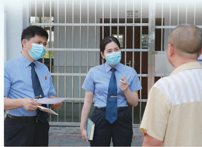
检察官向服刑人员宣讲相关法律政策

据悉,截至目前,该检察室已监督服刑人员执行财产性判项涉及服刑人员近百人,监督执行金额1160余万元,破解该领域“重判决、轻执行”问题成效初显。