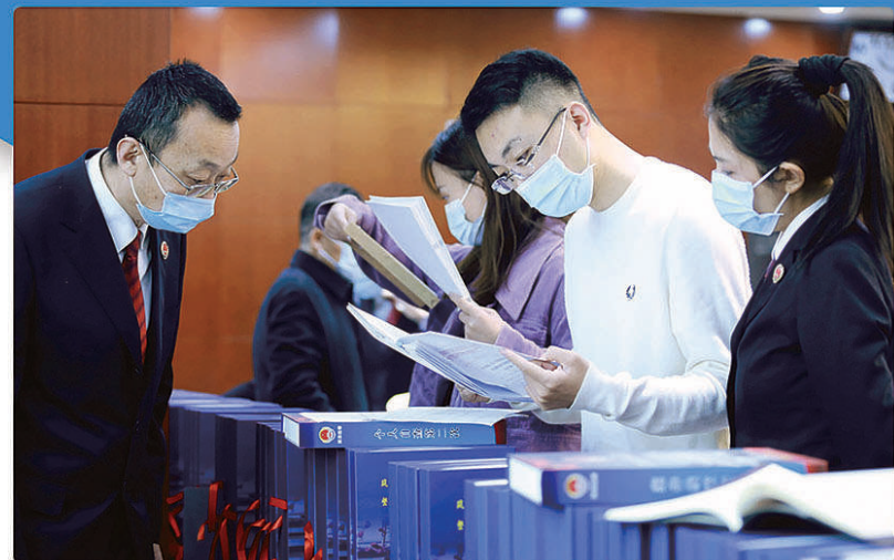
2021年11月,全国政法队伍教育整顿中央督导组在陕西省检察院督导检查。

“三个规定”有关事项16.2万件,是2020年的2.4倍。通过这些数据,可以看出检察机关强化自身建设的决心和成效。检察机关是法律监督机关,是维护社会公平正义的最后防线,更要保持检察队伍的纯洁。希望检察机关继续深化巩固教育整顿成果,坚持从严治检,进一步加强检察队伍建设和内部反腐败工作,完善堵塞制度漏洞,严防“灯下黑”,不断提升司法公信力。