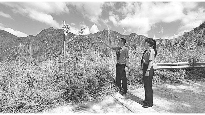
遂昌:检察官现场查看路面破损情况

开发利用门阵国共合作纪念碑亭等红色资源,为打造红色旅游研学基地贡献检察力量。据统计,仅2021年国庆期间,门阵村游客达4500余人次,同比增长125%,旅游收入达26万元,同比增长160%。