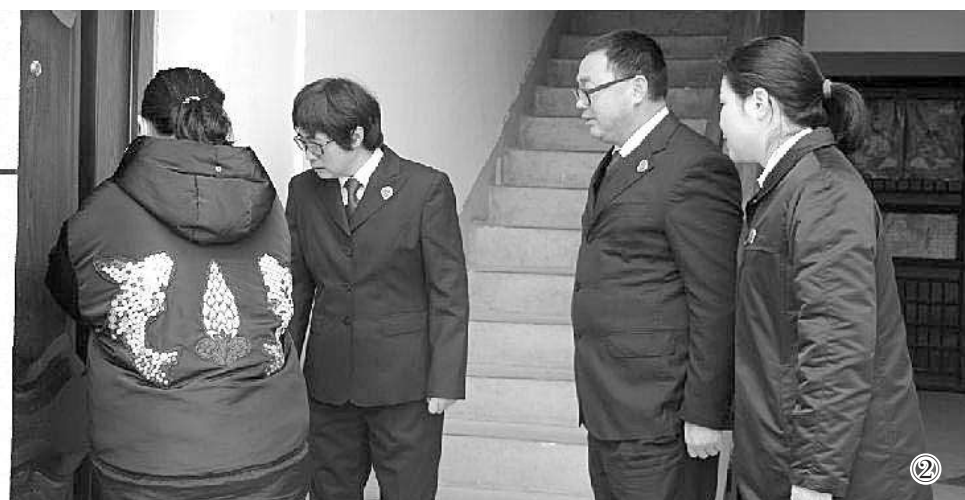
图② 办案检察官回访被执行人的生活保障落实情况