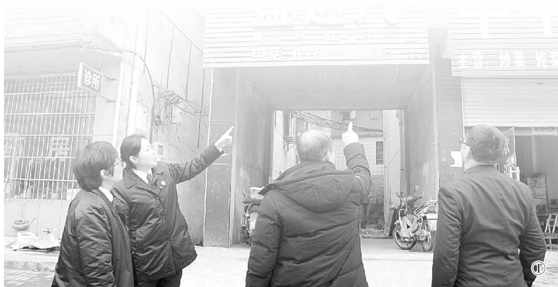
图① 办案检察官向证人了解核实案情

2021年4月28日,新县法院开庭审理此案,认为陈发以营利为目的,提供赌博场所和赌资,多次组织多人参与赌博,情节严重,以开设赌场罪判处有期徒刑四年六个月,并处罚金5万元。陈发当庭表示认罪悔罪。