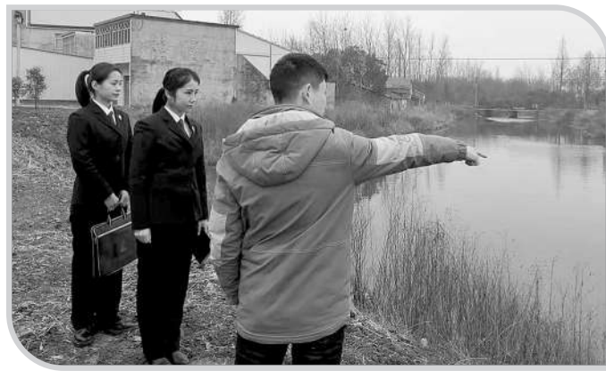
河南潢川:检察官对春河左支二河岸边生活垃圾整改情况“回头看”