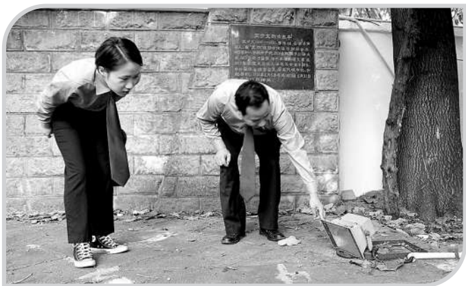
安徽芜湖镜湖:检察官在“回头看”时发现“步文亭”照明设施损坏