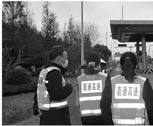
检察官到高速公路收费站开展货车收费情况调查