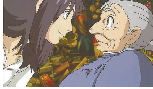
右图:《哈尔的移动城堡》中苏菲经典语录:“年纪大的好处就是,可以失去的东西很少。”

种新机械新工具体应运而生,仿佛架空在真实历史上的平行空间,人们在那里生存并期待科技与机械可以加速变革这个社会,而这正是蒸汽朋克与赛博朋克最大的不同。