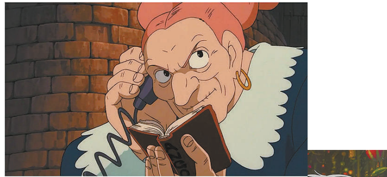
上图:《天空之城》中的海盗朵拉

《天空之城》里飞行装置的设计理念非常契合影片带点蒸汽朋克元素的风格,少年巴鲁带着少女希达乘坐空中海盗朵拉的飞行船前往拉普达,而在此之前,他俩被朵拉一伙和慕斯卡带领的军队围追,在城市、地下和天空中展开逃亡。巨型的蒸汽机械加上怪诞的非主流风格,使得1986年影片上映时并未获得太大反响,即便时至今日,蒸汽朋克也仅限于一定的受众人群,其实与其风格化的特征有关。爱因斯坦曾说过,想象力比知识更重要。同样来自于以科技为元素进行描述,蒸汽朋克在工业科学革命的基础上建立了一个落后与先进共存、魔法与科学共存的“过往”,例如维多利亚工业革命的历史时期中,硕大的蒸汽设备上各