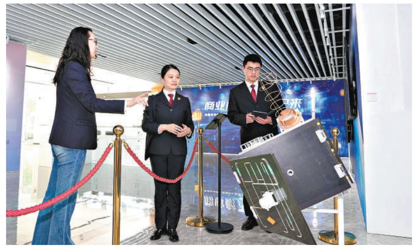
4月20日,上海市闵行区检察院检察官调研了解商业火箭发展情况和知识产权保护需求。