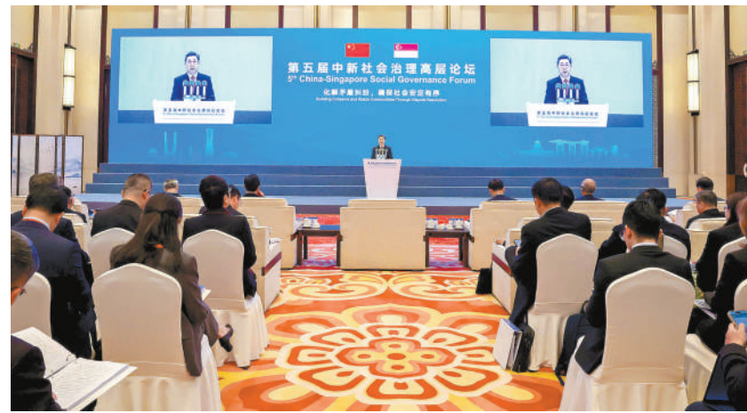
第五届中国社会治理高层论坛20日在浙江杭州举行。中共中央政治局委员、中央政法委书记陈文清出席并致辞。

陈文清表示,中非有着深厚的历史文化渊源,在两国领导人战略引领下,中非关系提升为全方位高质量的前瞻性伙伴关系。希望双方通过本次论坛,聚焦“化解矛盾纠纷,确保社会安定有序”这一主题,充分交流、平等互鉴,携手为社会治理贡献东方智慧。