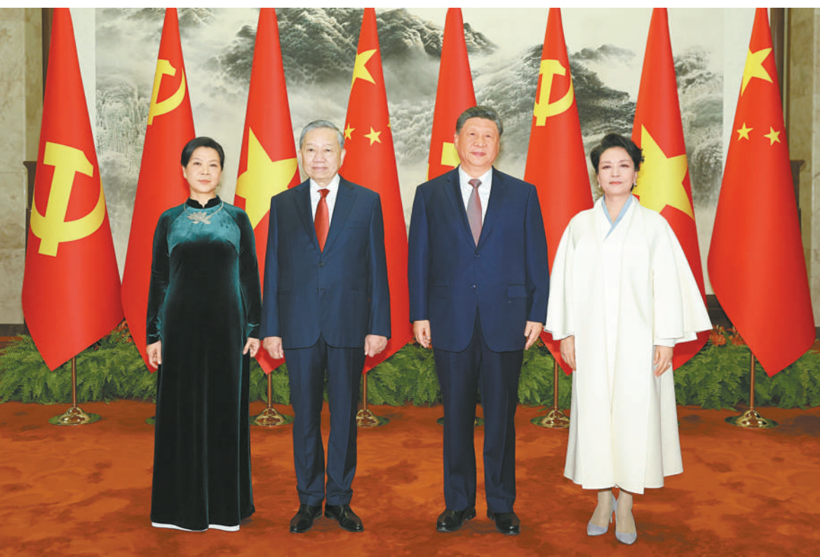
四月十五日上午，中共中央总书记、国家主席习近平在北京人民大会堂同来华进行国事访问的越共中央总书记、国家主席苏林举行会谈。这是会谈前，习近平和夫人彭丽媛同苏林和夫人吴芳瑞合影。

新华社北京4月15日电(记者冯敬然 董雪) 4月15日上午，中共中央总书记、国家主席习近平在人民大会堂同来华进行国事访问的越共中央总书记、国家主席苏林举行会谈。 习近平再次祝贺苏林当选越南国家主席。习近平指出，你当选越南国家主席后第一时间到访中国，体现了你对发展中越关系的高度重视。相信在以苏林同志为首的越共中央坚强领导下，越南必将坚定走好社会主义道路，朝着建党建国“两个一百年”奋斗目标砥砺前行。无论国际形势如何变化，中方始终将越南作为周边外交优先方向，愿同越方秉持初心、赓续友谊，团结协作、相互支持，继续按照“六个更”总体目标，高质量推进全面战略合作，加快构建更高水平具有战略意义的中越命运共同体，为推动构建人类命运共同体作出更大贡献。