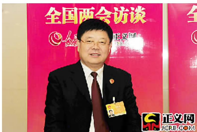
海南省检察院检察长贾志鸿做客正义网、人民网联合推出的“2015全国两会系列访谈”。

本报北京3月9日电(记者吴平 高鑫)“海南省检察机关将进一步加大办案力度，继续坚持‘老虎’‘苍蝇’一起打，始终保持惩治腐败高压态势。”3月9日，海南省检察院检察长贾志鸿做客正义网、人民网联合推出的“2015全国两会系列访谈”，结合海南省检察工作，就查办和预防职务犯罪、司法规范化建设、司法改革试点等问题与网友进行了交流。