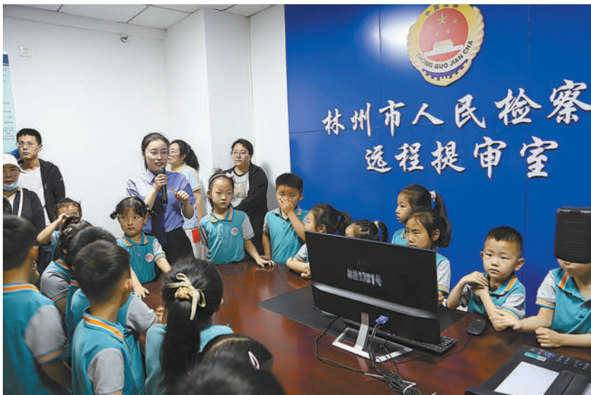
2025年5月,林州市检察院举办“携手关爱 共护未来”主题检察开放日活动,邀请学生、家长及教师代表90余人走进检察机关,沉浸式了解检察工作。