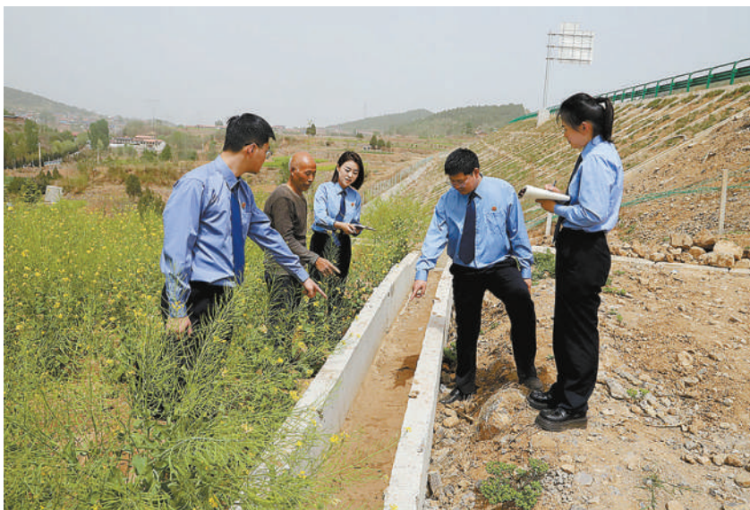
2025年4月,林州市检察院公益诉讼检察官对被损毁梁段的修复情况开展“回头看”。