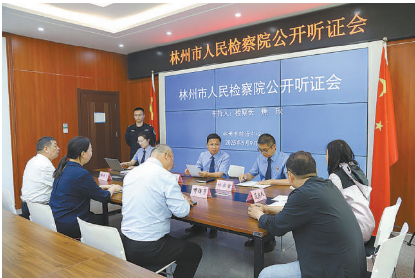
2025年5月,林州市检察院党组书记、检察长焦瑛在林州市综治中心主持召开公开听证会。

在训诫过程中,该院主动引入多元主体共同参与,邀请人大代表、政协委员、人民监督员等参与训诫程序,认真听取参与人意见,动态调整训诫重点,确保训诫发挥实效。代表委员积极参与并提出改进建议,让司法公信力在公开透明中得到显著提升。该院深化“不诉≠不罚”理念,规范推动不起诉后的非刑罚责任落地。2024年以来,该院共对128件不起诉案件提出行政处罚检察意见,并及时移送行政机关,推动社会治理效能提升。