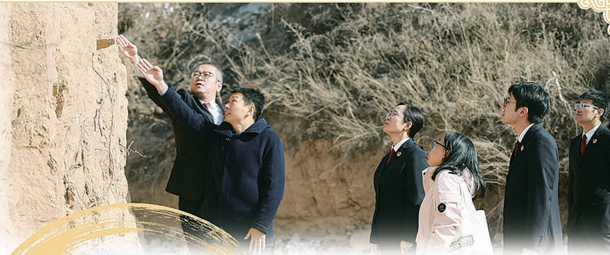
▲ 2025年1月,陕西省关中平原地区检察院检察人员和陕西省考古研究院、渭南市博物馆专家一起在澄城县战国魏长城遗址实地查看遗址情况。 ► 陕西省华阴市的魏长城遗址。

公元前647年,晋国遭遇旱灾,晋惠公向秦国求助,秦穆公以德报怨,泛舟运粮援晋。然而次年秦国