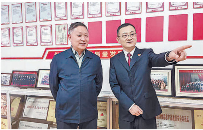
孙斌代表(左)在黑龙江省双鸭山检察院调研检察工作。