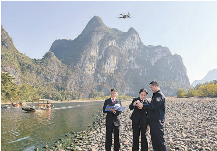
今年十月,阳朔县检察院干警在漓江风景名胜区和资源保护领域公益诉讼线索。

漓江,是珠江上游西江水系的重要支流之一、中国南方生态屏障的重要组成部分,恰如一条青罗带,蜿蜒于碧玉簪般的喀斯特群峰之间,是桂林山水之魂,也是享誉世界的“中国旅游名片”。