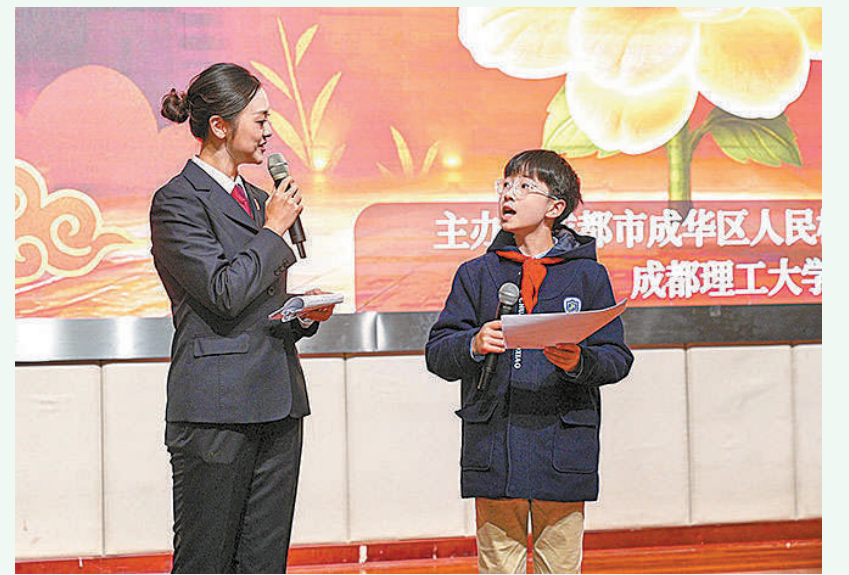
在情景剧演绎现场,作为主持人的检察官针对剧中涉及的法律问题展开专业解读。

活动邀请了四川省德阳市罗江区检察院、重庆市大渡口区检察院的检察人员,以及当地小学生、家长代表现场观看。“普法不能只是念条文,而是要让法治精神真正走进孩子们的心里。在国家宪法日来临之际,我们希望通过这种寓教于乐的方式,实现普法教育从‘单向灌输’到‘现场沉浸’的转变,让法治的种子在孩子们心中生根发芽。”