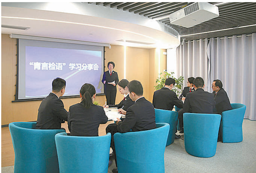
今年12月,南通市崇川区检察院组织“青言检语”圆桌会活动,优秀检察官和年轻干警一起分享履职故事,交流办案心得。

“赛心检行”文化品牌注重“赛中学”,该院搭建育人平台,成立青年检察官学习社,依托“静海法声”研学堂组织模拟庭审对抗等专题培训活动;组织“青骑兵”演讲赛、“雏鹰杯”检察业务竞赛等练兵比武,储备多层次人才梯队,用比武竞赛带动全院干警争先创优,提升本领。 “以前觉得自己好好办案就行,现在有了练兵比武,通过和同事比、和