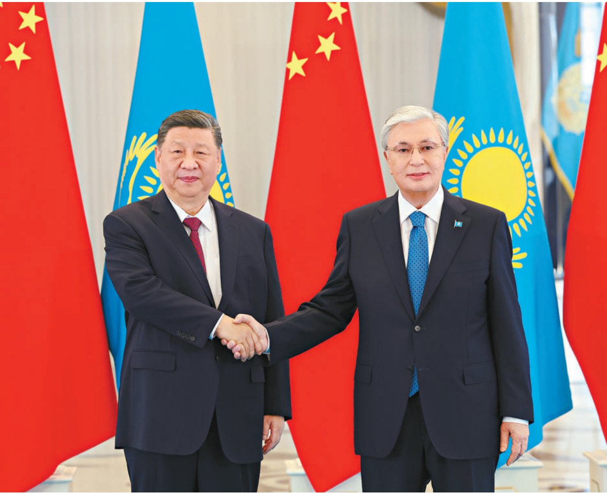
当地时间六月十六日下午，哈萨克斯坦总统托卡耶夫同中国国家主席习近平在阿斯塔纳举行会谈。

新华社阿斯塔纳6月16日电(记者倪四义 胡晓光) 当地时间6月16日下午，哈萨克斯坦总统托卡耶夫同中国国家主席习近平在阿斯塔纳总统府举行会谈。