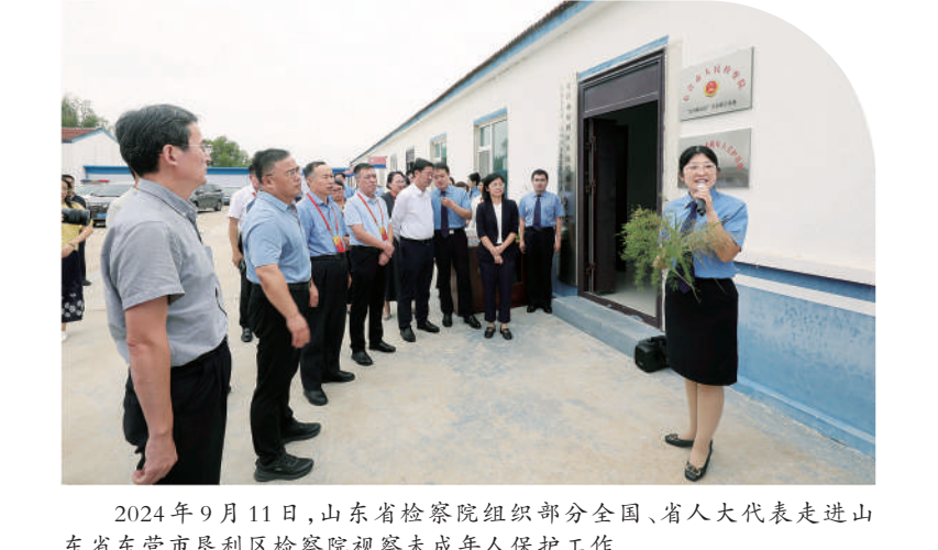
2024年9月11日,山东省检察院组织部分全国、省人大代表走进山东省东营市垦利区检察院视察未成年人保护工作。