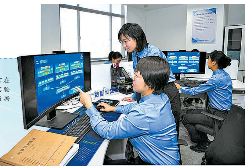
检察官在电子数据实验室对模型数据进行分析。

鉴于该案系借文旅名义开展非法集资的新发案件,该院在案件办完后及时总结并撰写了题为《当前旅游公司以“定制旅游”为名 实施新类型非法集资活动多发亟待引起重视》情况分析报告,从公司类型、运营方式、宣传对象、作案模式等方面分析旅游公