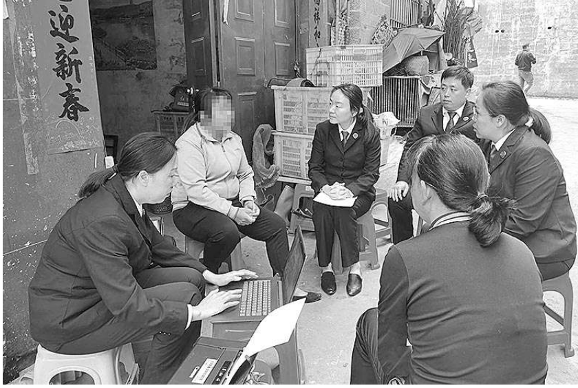
百色市检察院控告申诉检察部党支部干警上门听取申诉人意见。

同时,该党支部拓宽党建联盟,开展结对共建工作,与西林县检察院共同推进全区民族团结进步示范单位、模范机关示范点等创建活动,指导西林县检察院成立“红石榴”工