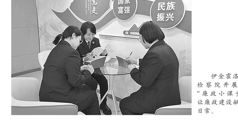
伊金霍洛旗检察院开展的“廉政小课堂”让廉政建设融入日常。

大美绿城伊金霍洛,黄河“几字弯”里的“创绿者”,是一代天骄成吉思汗眷恋的灵魄家园。成吉思汗跨马挥刀,严格军纪,制定了一系列廉政政策。他的掌权、堂兄、叔父遭反革命夺去了珍宝,事后都受到严厉的惩罚。成吉思汗的廉政思想和决策也影响了他的部属和后代,通过明晰监察体系,推动廉政建设,构筑了一道坚不可摧的清风高墙。