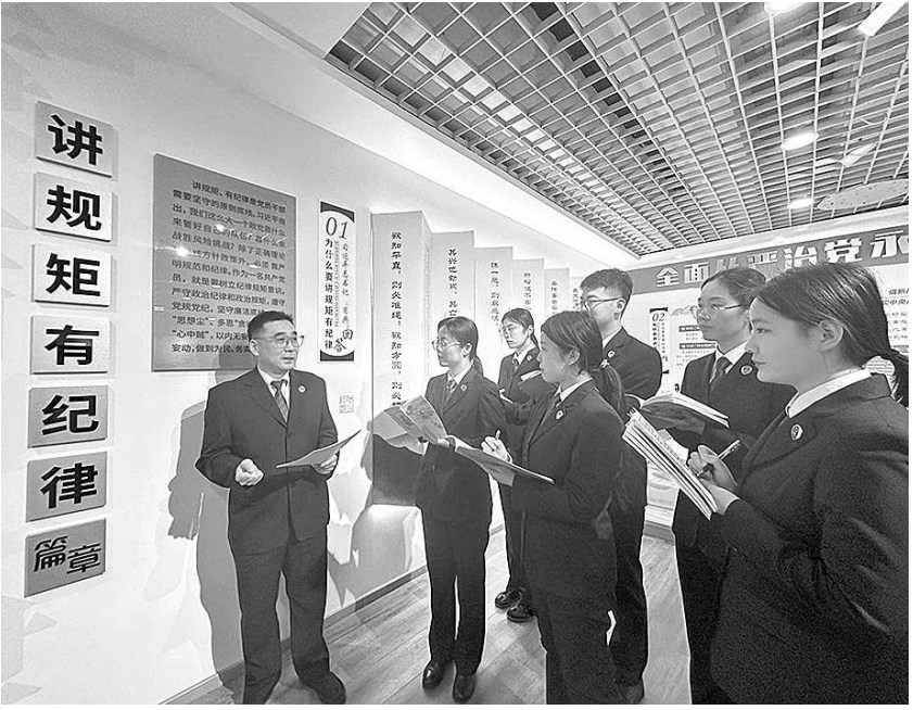
近日,山东省滕州市检察院党员教育实践中心举行警示教育,组织青年检察官参观警示教育片,参观廉洁教育展厅。图为该院检察督察办公室主任在给青年干警讲“三个规定”等办案纪律要求。

铜陵市检察院扎实推进“一单位一品牌,一支部一特色”创建,围绕“淬铜检心”品牌,打造“亲清有为·商约检行”等5个支部特色品牌,锻造党建品牌矩阵,着力把党建融入中心、服务大局;深入开展“检察为民办实事”活动,着重从办好群众身边“小案”、化解涉法涉诉信访、营造法治化营商环境、开展司法救助等方面,推出便民利民措施。