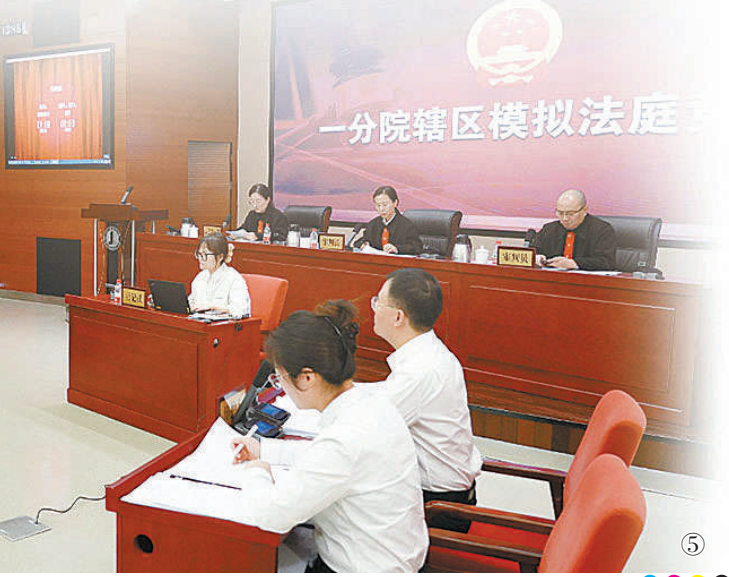
图⑤：2024年10月24日，上海市检察院第一分院举行模拟法庭竞赛。