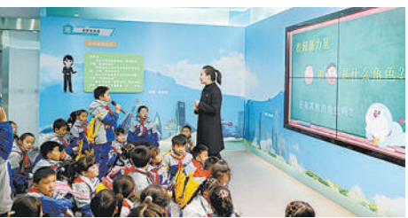
成都市青白江区检察院未检检察官为同学们讲解如何预防和应对校园欺凌。

该院还结合自贸区、中欧班列等地域特色，精心打造青少年法治教育基地，通过取票、检票进站、乘坐“列车”等形式，带领同学们沉浸式学习法律知识，构建起学校、社会、家庭“三位一体”青少年法治教育体系。