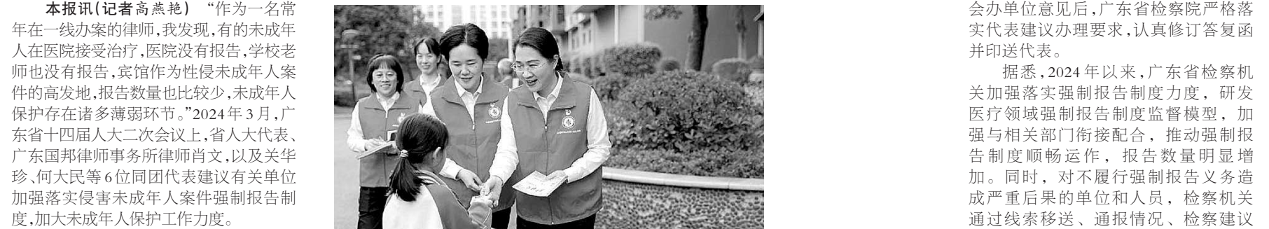
广东省东莞市第三市区检察院未检检察官深入社区派发法治宣传手册。